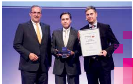
Versender des Jahres 2013: BUTLERS